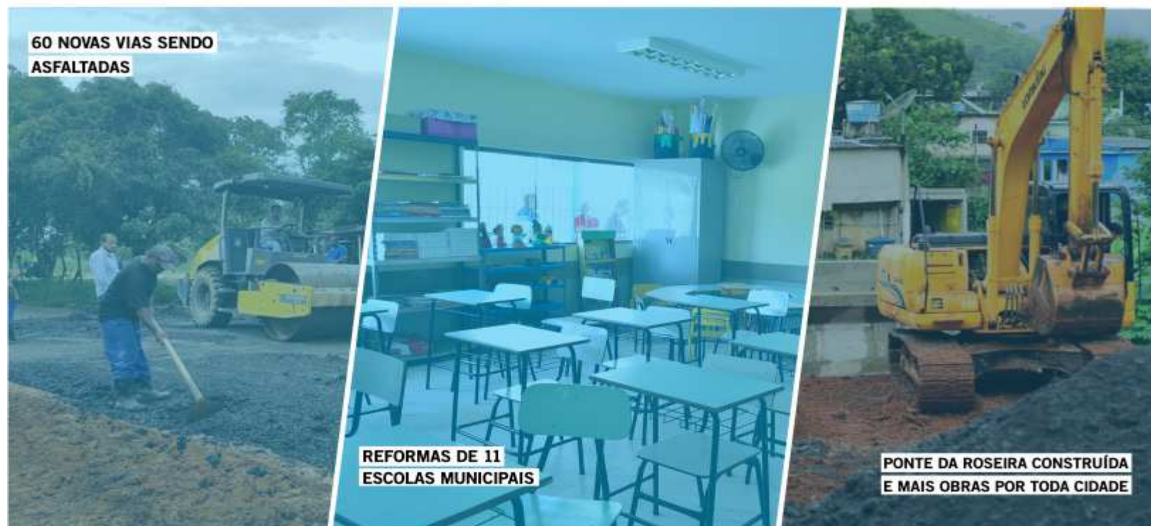
60 NOVAS VIAS SENDO ASFALTADAS